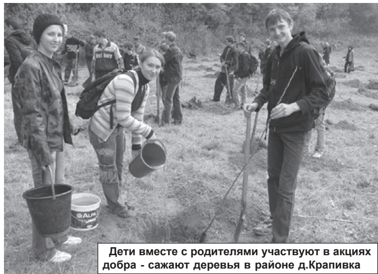
Дети вместе с родителями участвуют в акции добра - сажают деревья в районе д.Крапивка

уверяют, что наши мечты просто не в курсе того, что должны сбываться