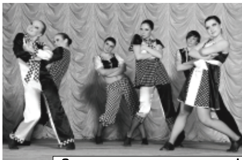
«Звоны» тоже за праздник!