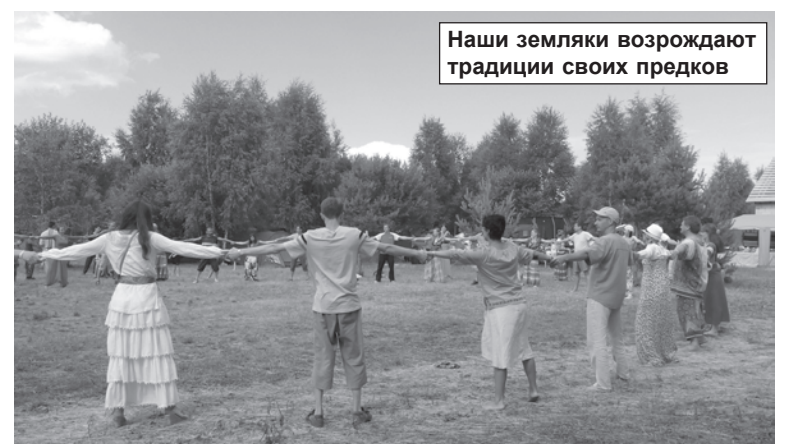
Наши земляки возрождают традиции своих предков

только на первый взгляд, пока ты незнаком с философией этих людей, для которых нет ничего невозможного.