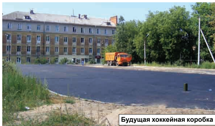
Будущая хоккейная коробка

Рабочие смоленской строительной организации ООО «СП» в эти дни вручную укладывают асфальт на территории будущей хоккейной коробки. Делают это вручную, потому как тяжелая специализированная техника во двор пробраться не может. Следующий этап – асфальтирование двух площадок. Одна из них будет предназначена для волейбола и баскетбола, а другая – универсальная, на которой планируется расположить брусью,