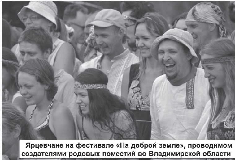
Ярцевчане на фестивале «На доброй земле», проводимом создателями родовых поместий во Владимирской области

где человек в отличие от городской квартиры чувствует себя совсем по-другому.