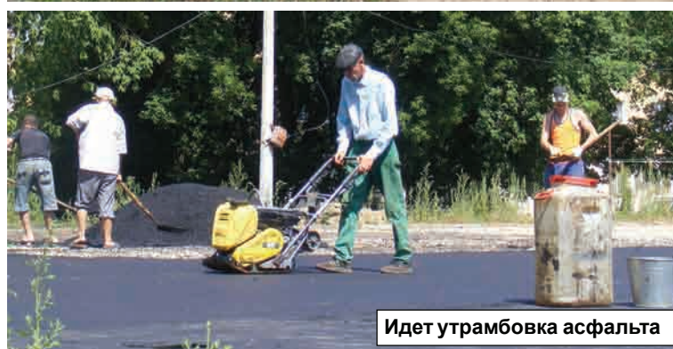
Идет уtramбовка асфальта

шведскую стенку и другие снаряды для желающих заняться оздоровительной физкультурой.